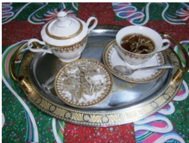
Ceaiul în lumea arabă

Primul eveniment organizat de CCERPA, Centrul Cultural European Româno-Panarab și Institutul Confucius din București, a avut loc în capitală, luni, 23 Martie 2015, la sediul institutului. Evenimentul de deschidere al colaborării celor două instituții a constat într-o ceremonie a ceaiului, tradiție binecunoscută în lumea chineză, preluată și de lumea arabă.